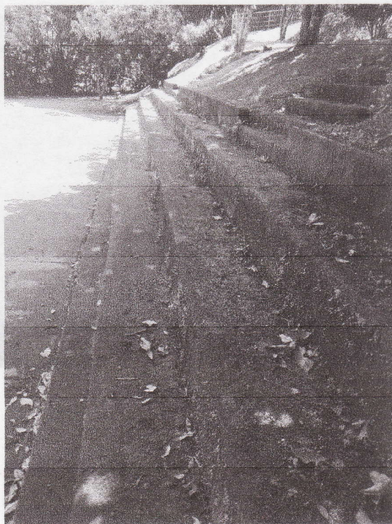
La gradería carece de mantenimiento y limpieza.