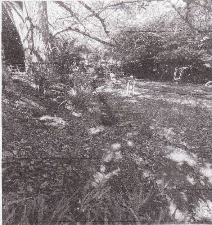
Se debe reestructurar el sistema de desfogue de agua pluvial. El equipo de ejercicios está sin mantenimiento.